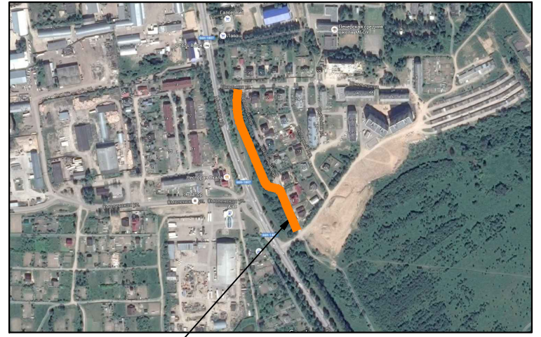
место размещения линейного объекта