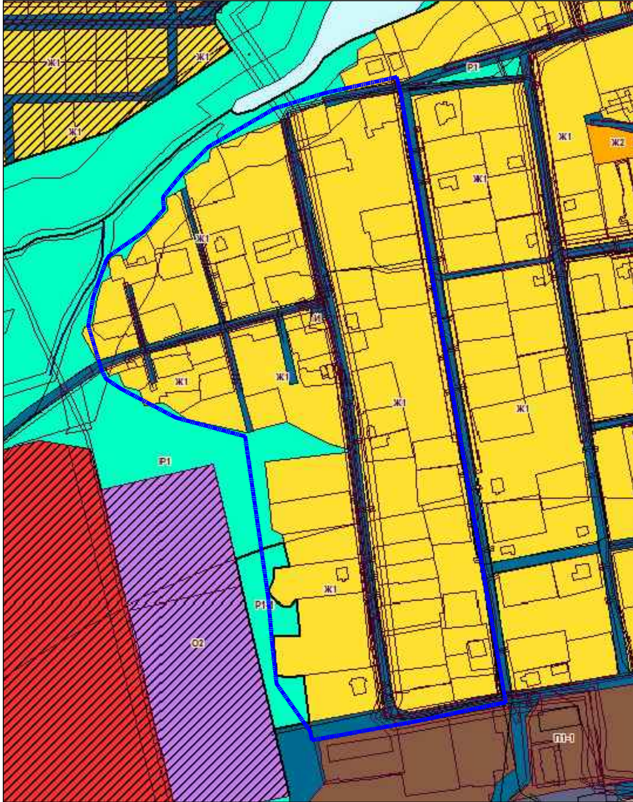
Фрагмент Карты градостроительного зонирования Печерского сельского поселения в соответствии с Правилами землепользования и застройки Печерского сельского поселения Смоленского района Смоленской области

Границы земельных участков, поставленных на кадастровый учет